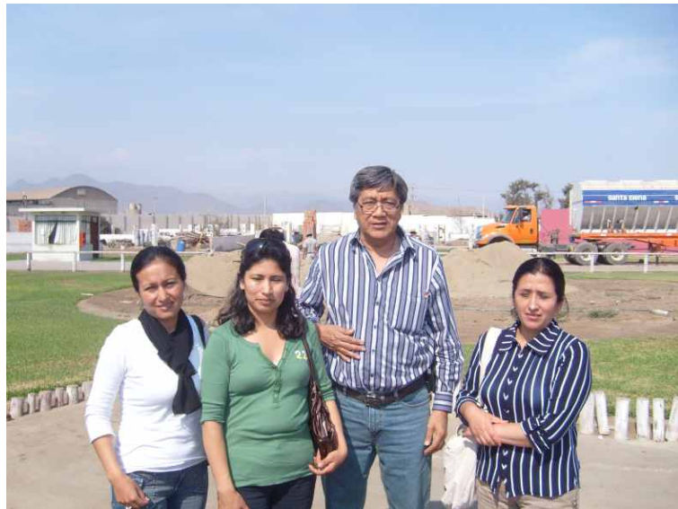
Nuestro Director junto a algunas ejecutivas de la empresa ecuatoriana INCUBANDINA S. A.